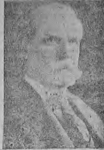
MR. CHARLES H. HUGHES

El último discurso del Secretario de Estado norteamericano Mr. Hughes, lo pronunció el martes 20 del corriente y fué transmitido por radio con el objeto de que fuera escuchado en Centro y Sud América. Ese discurso, que sabemos contiene declaraciones importantes desde el punto de vista internacional, formó parte del programa de la décima noche radiográfica latino americana que celebróse bajo los auspicios de la Unión Panamericana. Tomaron parte artistas de Guatemala. Habló Hughes de las relaciones entre los Estados Unidos y la América Hispánica.